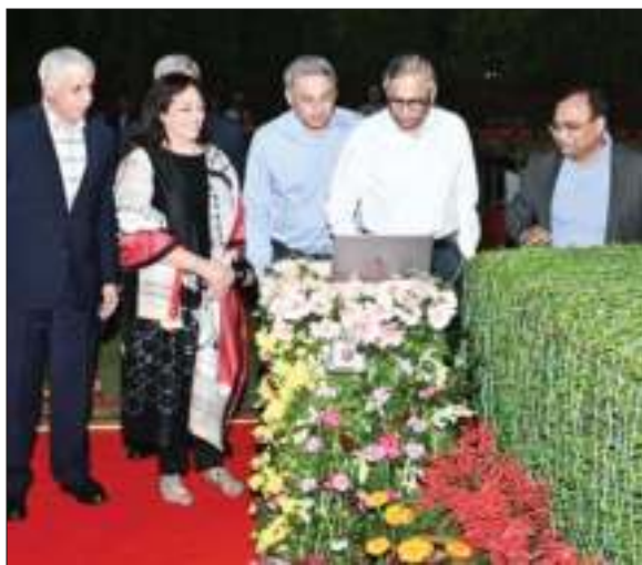
संस्थापक दिवस की पूर्व संध्या पर बटन दबाकर विद्युत सज्जा का उद्घाटन करते टाटा संस के चेयरमैन एन.चंद्रशेखरन।