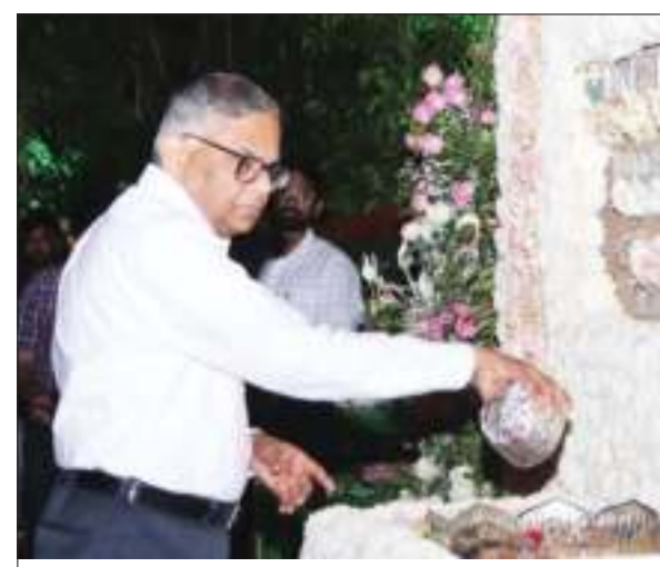
संस्थापक जे.एन. टाटा को श्रद्धासुमन अर्पित करते टाटा संस के चेयरमैन एन.चंद्रशेखरन।