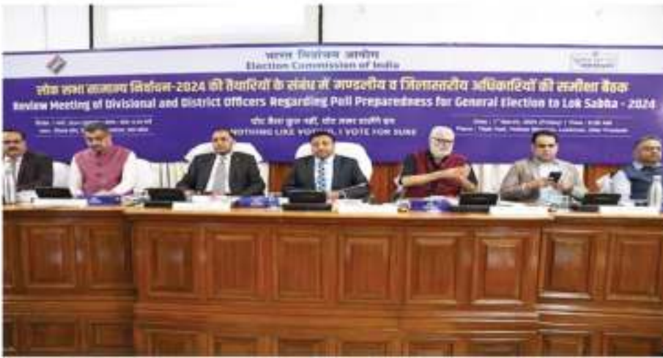
अवेध शराब, मुफ्त सामान और नकद राशि का वितरण रोकने, असामाजिक तत्वों को पाबंद करने, हथियार जमा करने, संवेदनशील मतदान केंद्रों पर सुरक्षा के इंतजाम सहित अन्य तैयारी की जानकारी ली। आयोग ने नामांकन पत्रों की जांच से लेकर मतगणना तक निष्पक्ष और पारदर्शी तरीके से करने के निर्देश दिए। आयोग ने कहा कि आचार

विधानभवन के तिलक हल सुबह करीब 10 से रात 8 बजे तक चली मैगथन बैठक में सीईसी और आयुक्त ने एक-एक जिलाधिकारी और पुलिस कप्तान से उनके जिले में चुनाव की तैयारी पर बात की। साथ ही उनसे 2019 और 2022 के मतदान प्रक्रिया, आणखी चुनक में मतदान प्रतिशत बढ़ाने के लिए किए प्रयास, मतदाता सूची पुनरीक्षण में बढ़ी महदाजओं की संख्या, मतदान केंद्रों पर पानी, बिजली, छाया, रैप, फर्नीचर की व्यवस्था, सदिध मतदान केंद्रों, मत चुनाव में आचार संहिता उल्लंघन के मामलों की समीक्षा की। वहीं पुलिस से जिलों में आवश्यक फोर्स,