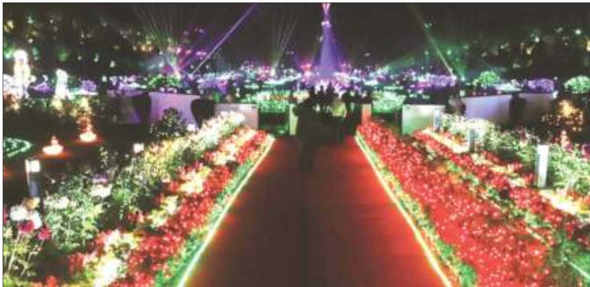
संस्थापक दिवस की पूर्व संध्या पर रंग-बिरंगी रोशनी से नहाया जुबिली पार्क।