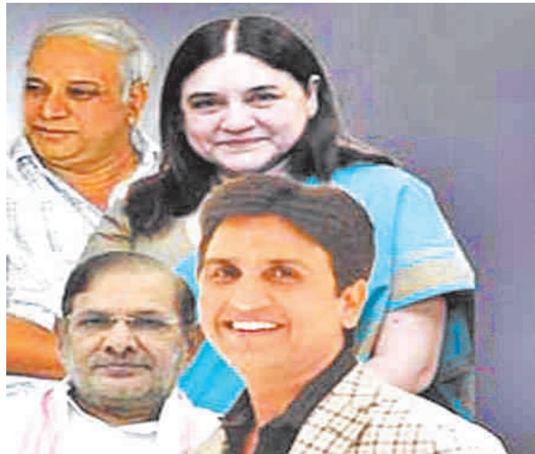
साथ जमानत तक गंवांनी पड़ी।